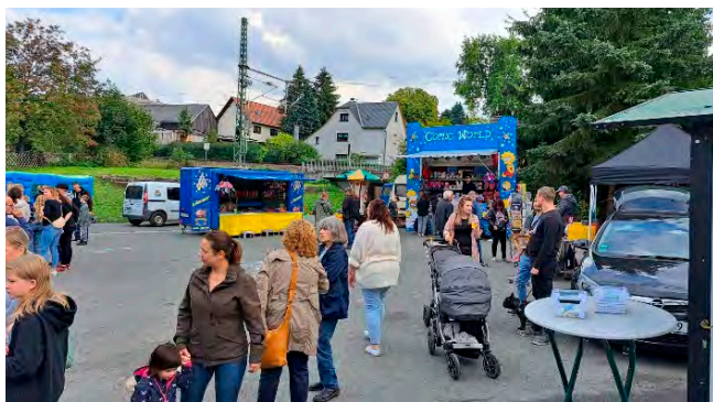
Buntes Markttreiben an beiden Tagen

Es grüßen Sie recht herzlich Der Feuerwehrverein und die FFW Ruppertsgrün