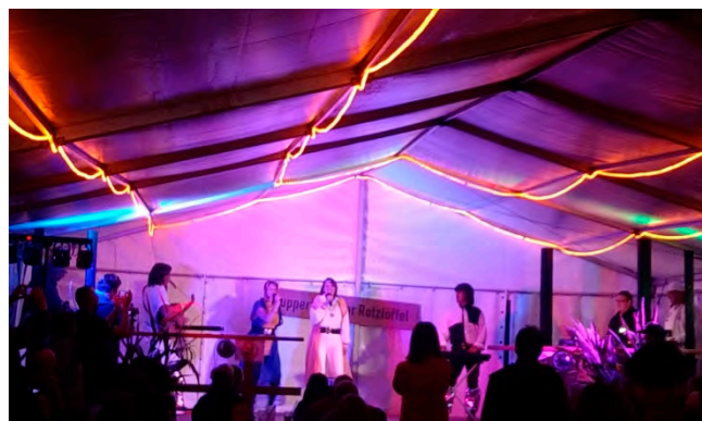
Abba mit Waterloo auf unser RSC Bühne