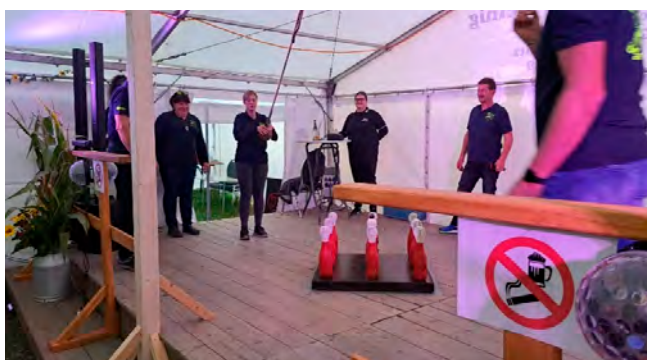
Unsere Damenmannschaft beim Galgenkegeln