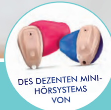
DES DEZENTEN MINI-HÖRSYSTEMS VON

eines WIDEX Im-Ohr-Hörsystems mit modernster Technologie für eine herausragende Klangqualität und ein ausgezeichnetes Sprachverständnis.