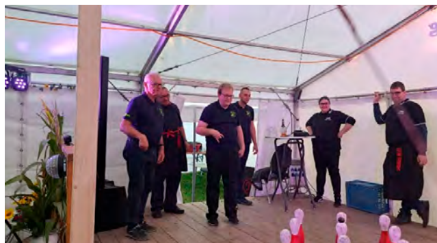
Unsere Herrenmannschaft beim Galgenkegeln

Es grüßen Sie recht herzlich Der Feuerwehrverein und die FFW Ruppertsgrün