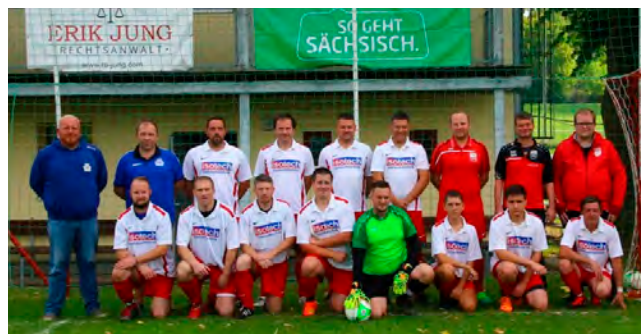
Spielgemeinschaft Coschütz/ Ruppertsgrün 2

Auf den weiteren Bildern sind unsere beiden Männermannschaften vor unserem neuen „so geht sächsisch“ Banner an unserem Vereinsheim in Ruppertsgrün zu sehen.