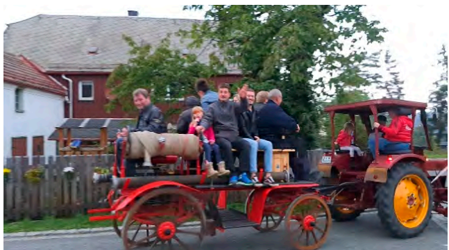
Gute Stimmung bei den Kutschfahrten