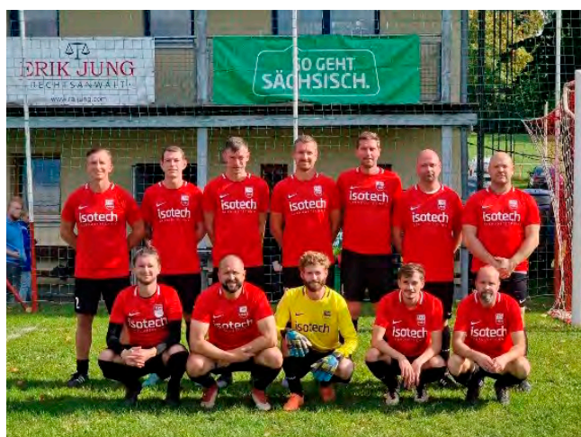
Erste Mannschaft TSG Ruppertsgrün

Auf dem Bild sind viele wichtige Elemente des Vereins abgebildet. Angefangen beim Frauensport, Trail Running bzw. Laufgruppe, Fußball und unser Wirt der zusätzlich noch die Dartpfeile fliegen lässt. Das ist alles super, aber ohne das ganze Ehrenamt wie die Instandhaltung des Geländes, des Fußballplatzes und und und würde es auch nicht funktionieren und hat daher einen hohen Stellenwert bei uns und ist deshalb auch mit auf dem Bild verewigt.