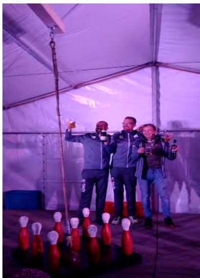
Die Sieger unseres Galgenkegelns: die Mannschaft der TSG Ruppertsgrün I